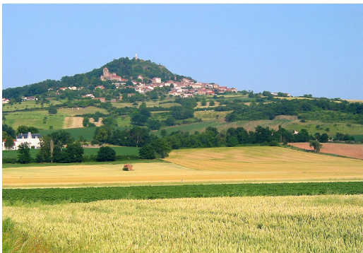
La plaine d'Usson en Auvergne

La faune est composée essentiellement d'animaux domestiques et d'élevage, de rapaces et d'oiseaux protégés.