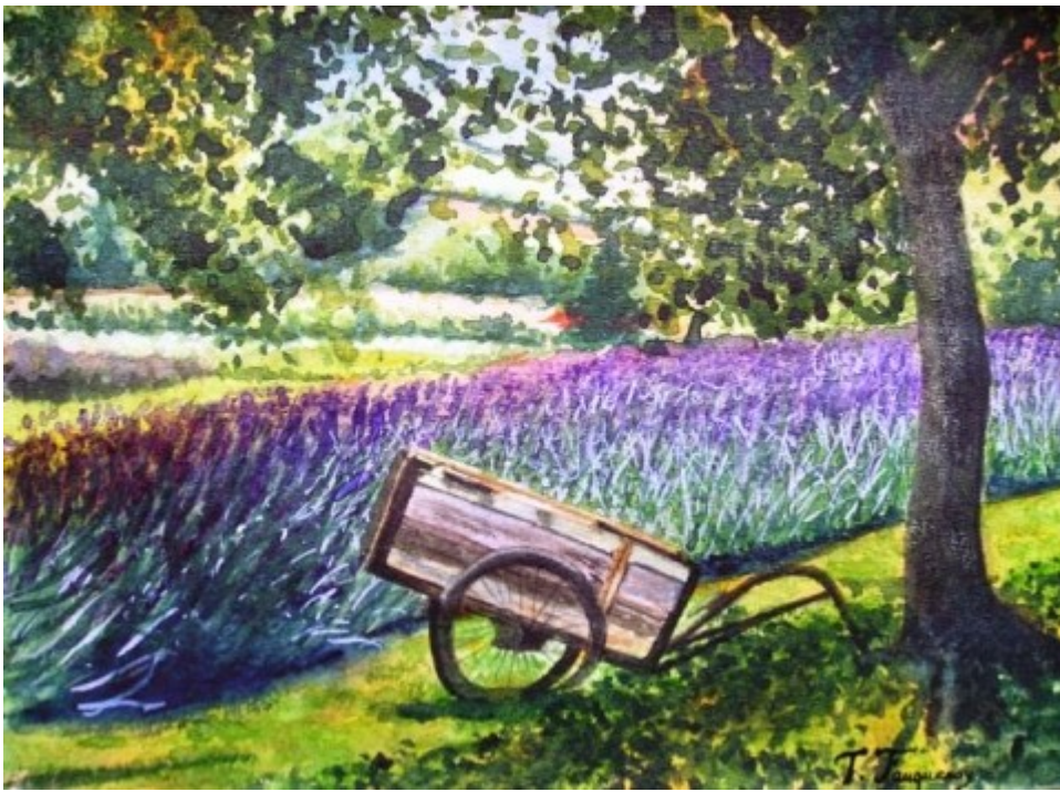
Champ De Lavande